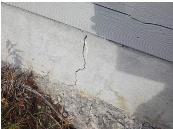
Bild 1: - Utvändigt, Grundmur/Hussockel, Krypgrund/torpargrund, se riskanalys. Lucka till grunden saknas så grunden är ej åtkomlig för kon...