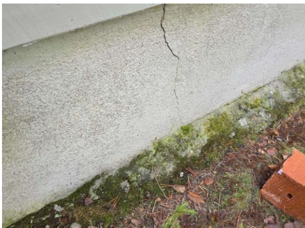
Bild 3: - Utvändigt, Grundmur/Hussockel, Krypgrund/torpargrund, se riskanalys. Lucka till grunden saknas så grunden är ej åtkomlig för kon...