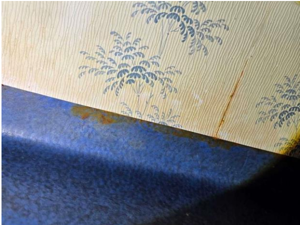
Bild 7: - Invändigt, Entréplan, Otäta rörgenomföringar i våtzone 1. Otäta fogar i tapet/mattskarvar. Den teoretiska livslängden h...