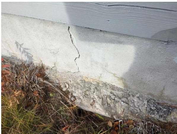
Bild 2: - Utvändigt, Grundmur/Hussockel, Krypgrund/torpargrund, se riskanalys. Lucka till grunden saknas så grunden är ej åtkomlig för kon...