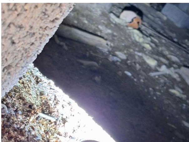
Bild 5: - Utvändigt, Grundmur/Hussockel, Torpargrund, se riskanalys Grunden endast åtkomlig via ventiler i grunden. Uppmätta fuktvärden 15...