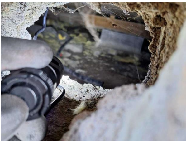
Bild 2: - Utvändigt, Grundmur/Hussockel, Torpargrund, se riskanalys Grunden endast åtkomlig via ventiler i grunden. Uppmätta fuktvärden 15...