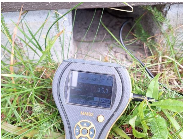
Bild 4: - Utvändigt, Grundmur/Hussockel, Torpargrund, se riskanalys Grunden endast åtkomlig via ventiler i grunden. Uppmätta fuktvärden 15...