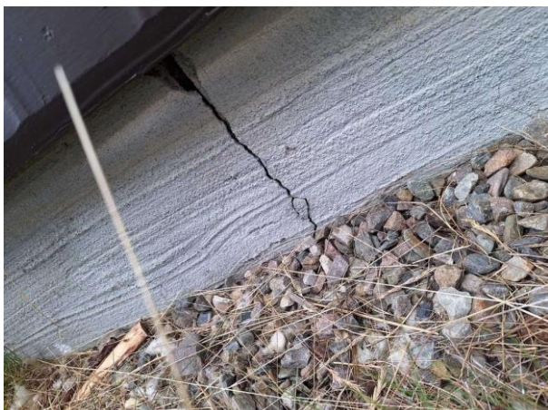
Bild 3: - Utvändigt, Grundmur/Hussockel, Torpargrund, se riskanalys Grunden endast åtkomlig via ventiler i grunden. Uppmätta fuktvärden 15...