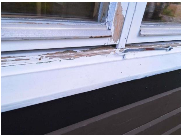
Bild 7: - Utvändigt, Fönster, Färgsläpp och kittskador på fönster. Fönsterbleck saknas.