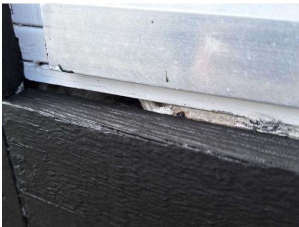
Bild 10: - Utvändigt, Fönster, Färgsläpp och kittskador på fönster. Fönsterbleck saknas.