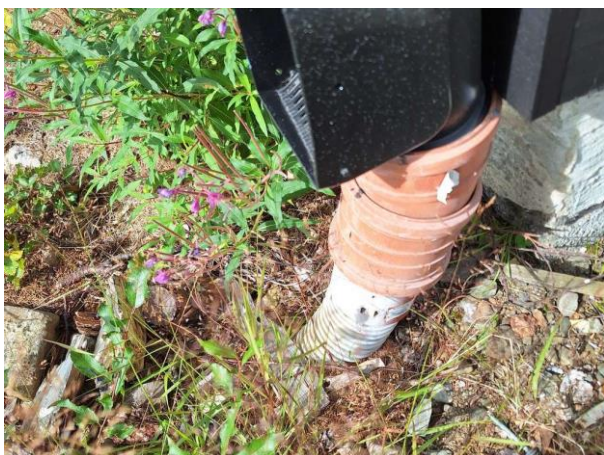
Bild 11: Utvändigt, Avvattning, Dagvattenrör är kopplade till dräneringsrör.