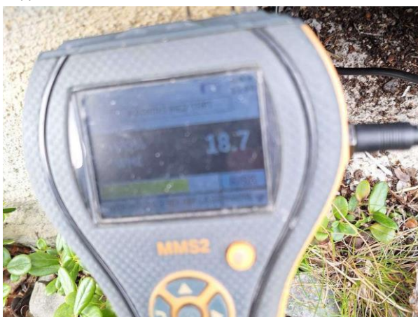
Bild 6: - Utvändigt, Grundmur/Hussockel, Torpargrund, se riskanalys Grunden endast åtkomlig via ventiler i grunden. Uppmätta fuktvärden 15...