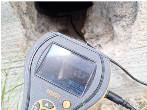
Bild 1: - Utvändigt, Grundmur/Hussockel, Torpargrund, se riskanalys Grunden endast åtkomlig via ventiler i grunden. Uppmätta fuktvärden 15...