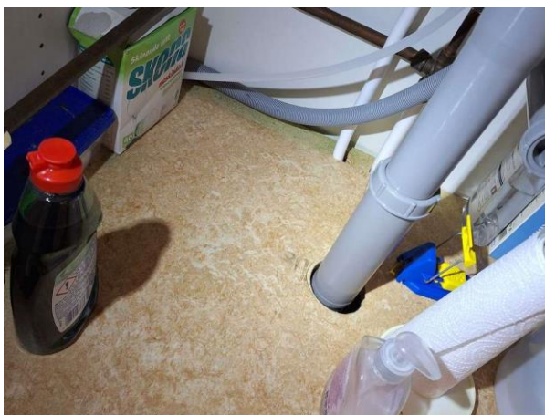
Bild 12: - Invändigt, Entréplan, Läckageskydd saknas under kyl. Otäta rörgenörföringar i diskbänkskåp.