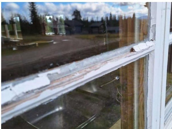
Bild 9: - Utvändigt, Fönster, Färgsläpp och kittskador på fönster. Fönsterbleck saknas.